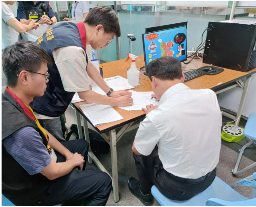
▲桃園分署人員前於桃園機場與鄭男作筆錄畫面