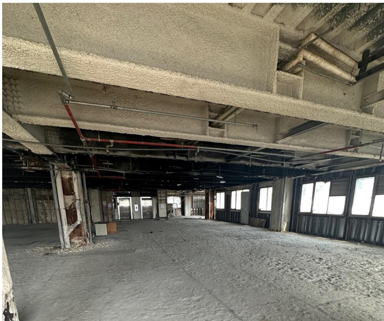
(圖：桃園區中正路366號5樓整層電梯商辦大樓)

桃園分署每月第1週、星期2、下午3時均定期舉辦「123聯合拍賣會」，歡迎民眾踴躍參與，更多法拍資訊，請參閱桃園分署官方網站與臉書訊息！