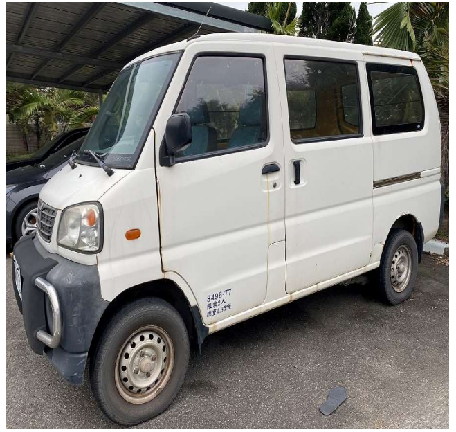
(圖：3月7日聯合拍賣會，拍賣車輛)