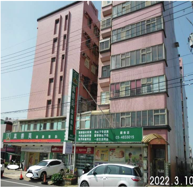
(圖：3月7日聯合拍賣會，觀音區新生路華夏)