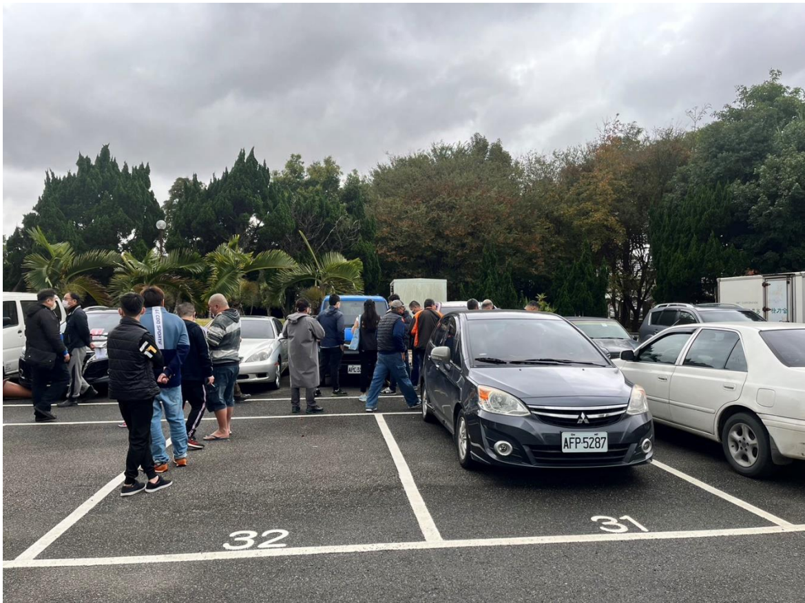
(法務部行政執行署桃園分署 112 年 1 月 3 日上午 10 時於桃園市桃園區富國路一百號舉辦聯合拍賣會，現場拍賣畫面)