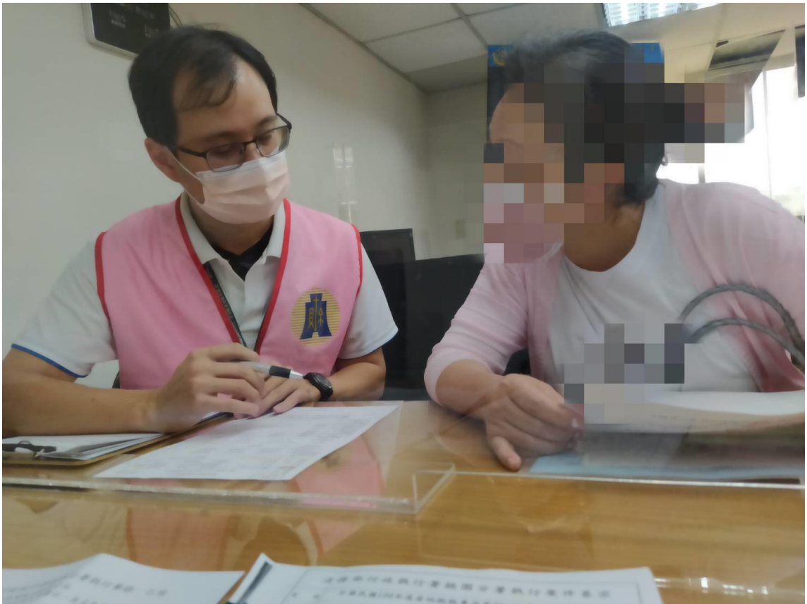
(上圖：移送機關財政部北區國稅局桃園分局稅務人員說明欠稅原因畫面)