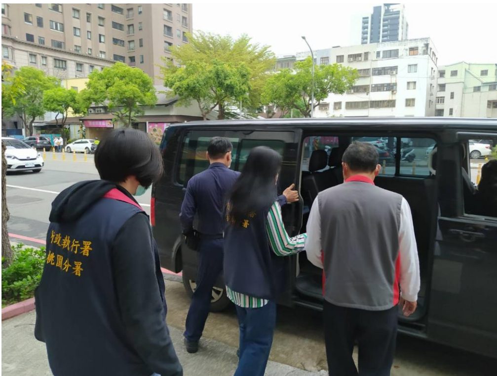
李男在前往桃園地院的途中 請妻子將欠款全部繳清

李姓男子在桃園市觀音區違法於租用之農地上鋪設瀝青、堆放砂土機具，遭裁罰新臺幣(下同)30萬元未繳而移送桃園分署執行。本分署調查李男財產及資金流向時，發現其在110年9月間收到處分書後，旋即將名下土地以84萬元之價格賣給兒子，李男到場陳述時，就不動產買賣原因及價金去向，均無法清楚交代，更稱沒有能力繳納罰鍰，經行政執行官訊問後，認其隱匿處分財產事證明確，決定向桃園地院聲請管收，就在出發前往地院路上，李男終於通知其妻將欠款全部繳清！