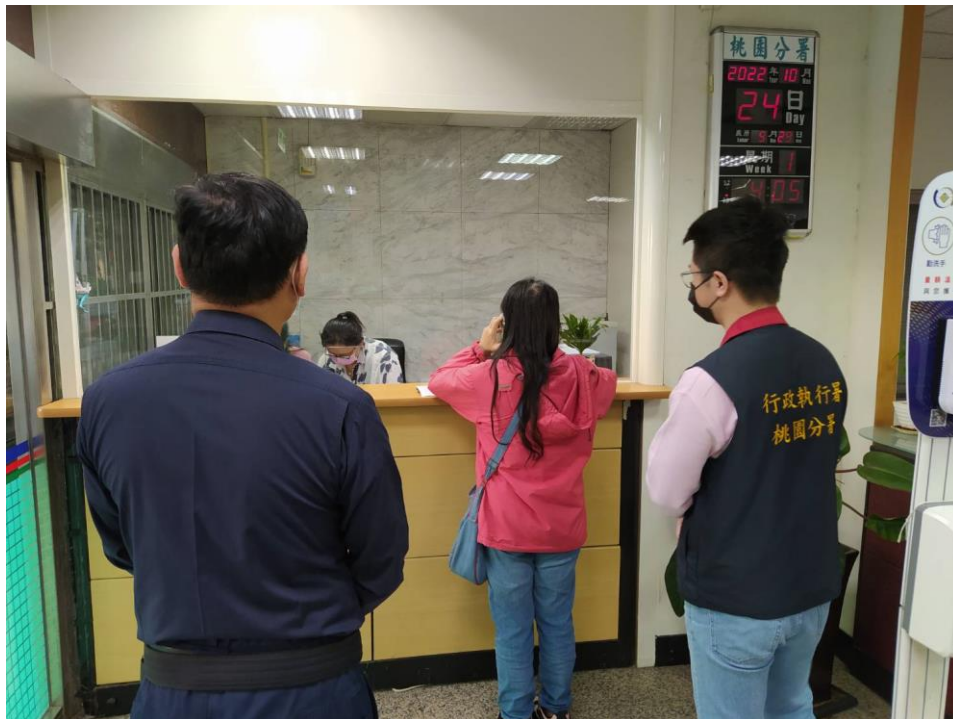
(上圖：張女 111 年 10 月 24 日至桃園分署說明及繳款畫面)