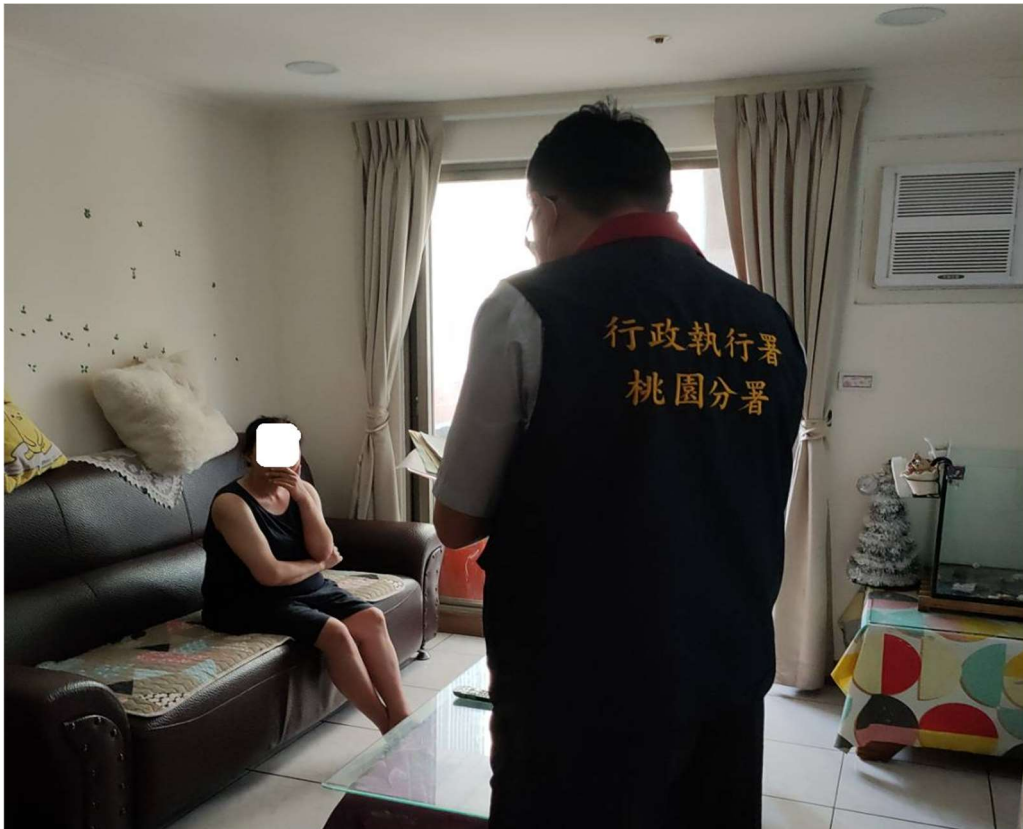
圖：桃園分署前往柳男八德區住居所現場查訪