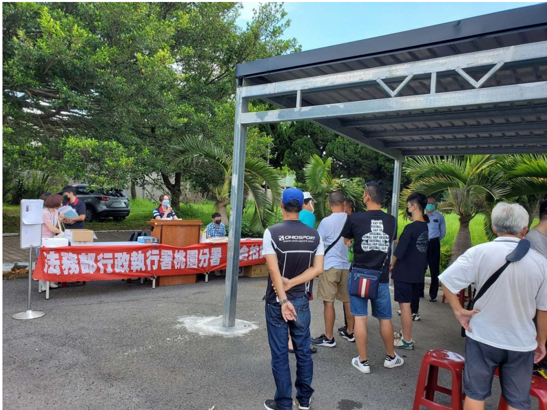
(圖：桃園分署111年7月5日「123聯合拍賣」車輛拍賣會現場)

本次拍賣會仍在防疫期間，桃園分署均依中央疫情指揮中心指示，對到場參與拍賣的民眾實施量測額溫，並請民眾戴上口罩始能參與拍賣，使到場民眾都能安心投標應買。桃園分署每月第1週、星期2、下午3時均定期舉辦「123聯合拍賣」，更多法拍資訊，歡迎民眾參閱桃園分署官方網站與臉書相關公告訊息！