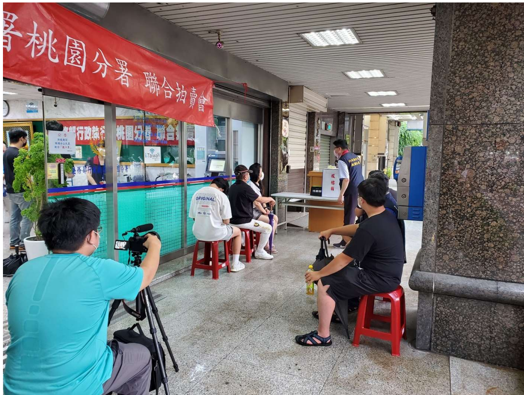
(圖：桃園分署111年7月5日「123聯合拍賣」不動產拍賣會現場)