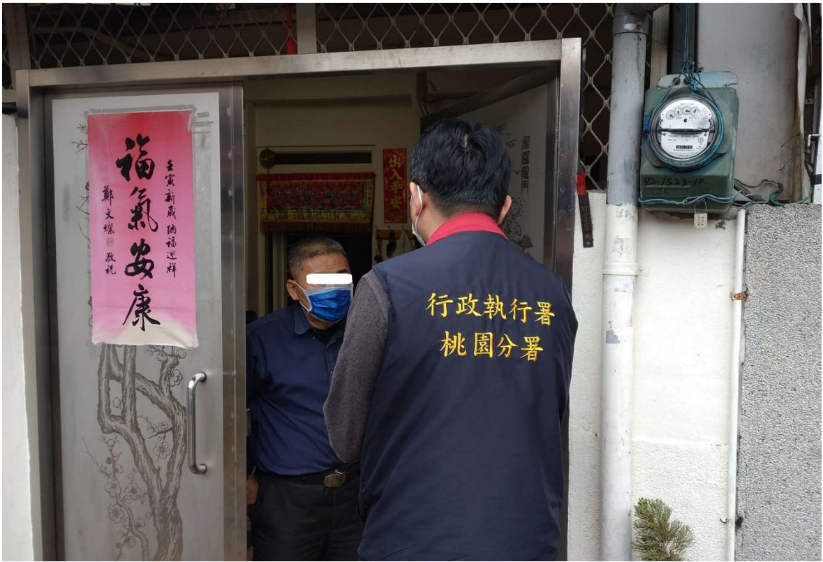
圖：桃園分署至大溪區胡男之住所現場執行