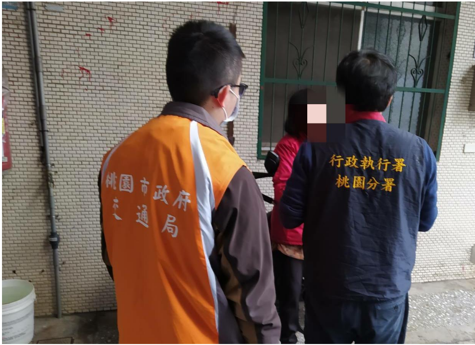
(上圖：桃園市張姓女子酒駕罰鍰案件，建物查封畫面)