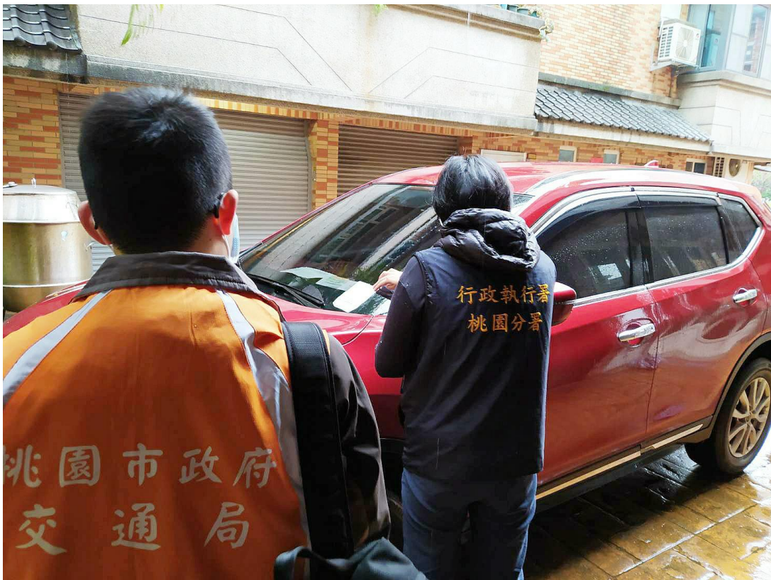
(上圖：桃園市林姓女子酒駕罰鍰案件，現場執行車輛畫面)