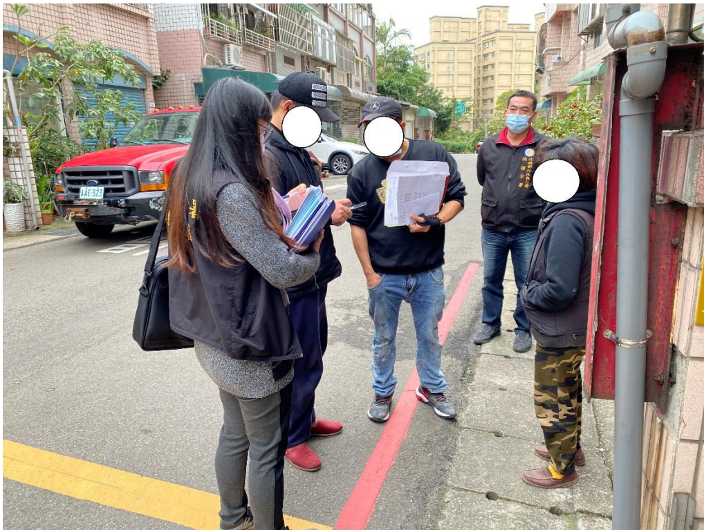
▲執行人員現場執行畫面