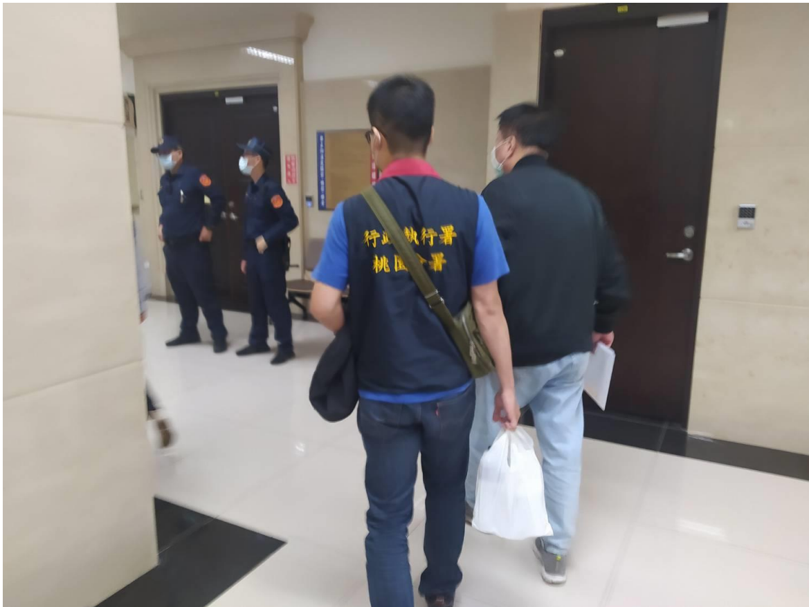
(上圖：法務部行政執行署桃園分署 110 年 11 月 3 日聲請管收畫面)