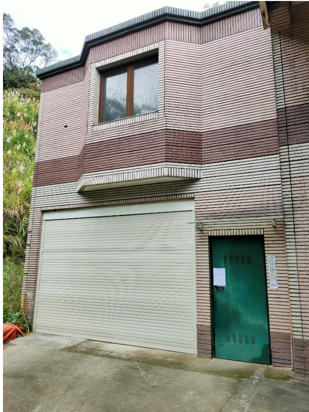
(上圖：110年10月5日聯合拍賣會，大溪區兩層樓透天)