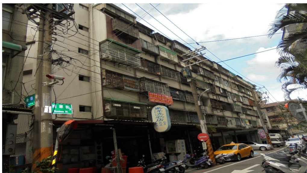
▲桃園區南華街公寓以 250 萬 2,000 元拍定