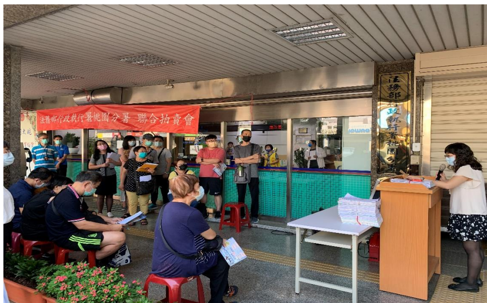
▲110 年 9 月 7 日桃園分署拍賣會現場

正值防疫期間，凡參與本分署拍、變賣的民眾，本分署均已請民眾配戴口罩。桃園分署每月第 1 週、星期 2、下午 3 時，均定期舉辦「123 聯合拍賣活動」，更多的詳細資訊，歡迎民眾至桃園分署的官網及臉書獲取相關訊息！