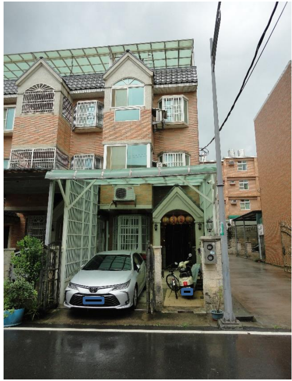
▲觀音區六合三街別墅外觀