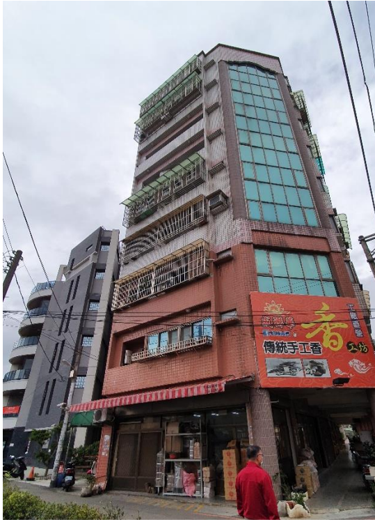
▲中壢龍仁路華廈外觀