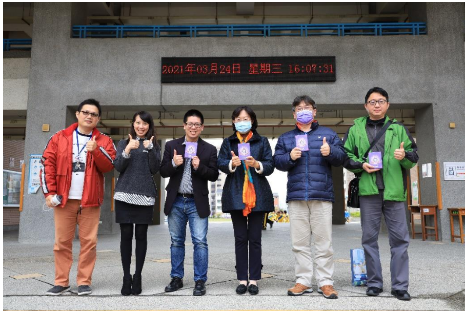
與青埔國中學務主任及桌遊社團老師合照