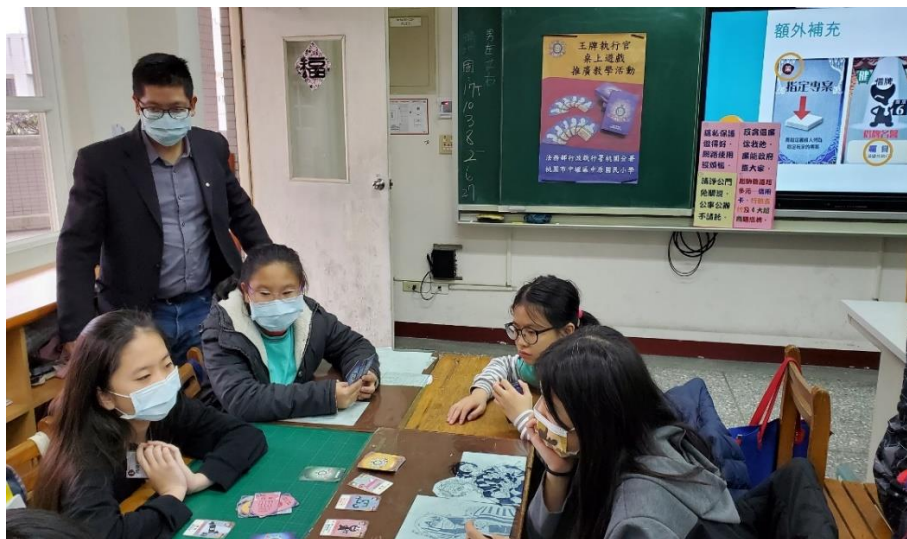
中原國小桌遊教學

本分署分別於110年3月23日及24日進入中原國小與青埔國中，以深入淺出方式介紹王牌執行官桌遊，讓同學藉由玩桌遊，知道國家會以不同類型的執行方法，對欠稅、欠罰、欠費的各類義務人的財產、人身自由施以強制執行，讓學生們在校園就能了解守法的重要，深獲學生們與校方的支持與認同，成效卓著。