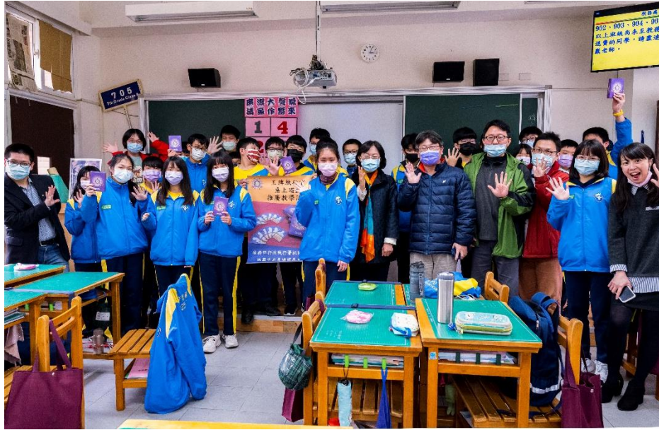
與青埔國中師生合照