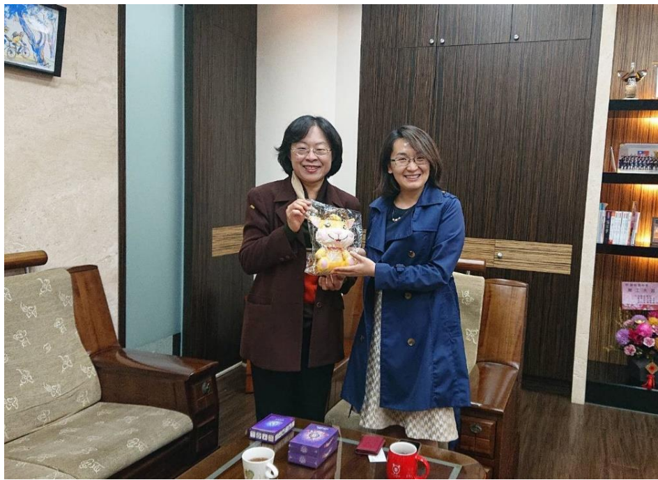
與桃園市政府青年事務局建立橫向聯繫管道

本分署與桃園市政府青年事務局、法務局等行政機關建立橫向聯繫管道，由青年事務局出借所屬「興光堡壘」之青年活動場所，作為 4 月 10 日與 5 月 22 日本分署舉辦「王牌執行官」桌遊試玩會與比賽之場地，且民眾可至現場免費索取桌遊卡牌，青年事務局同時利用舉辦青年育樂活動時協助推廣桌遊。本分署亦將於法制局定期舉辦之園遊會設攤推廣，鼓勵民眾參加預定於 5 月 22 日之桌遊比賽。