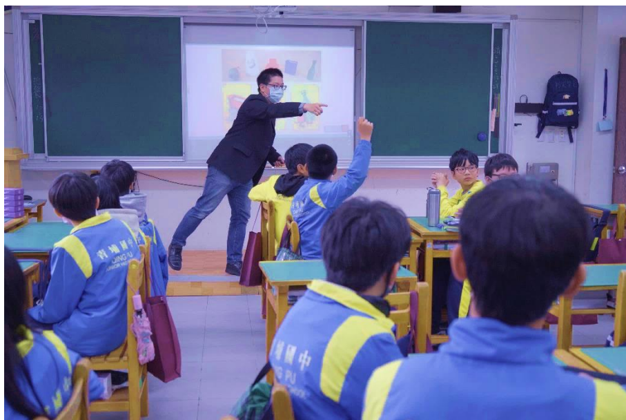
青埔國中桌遊教學