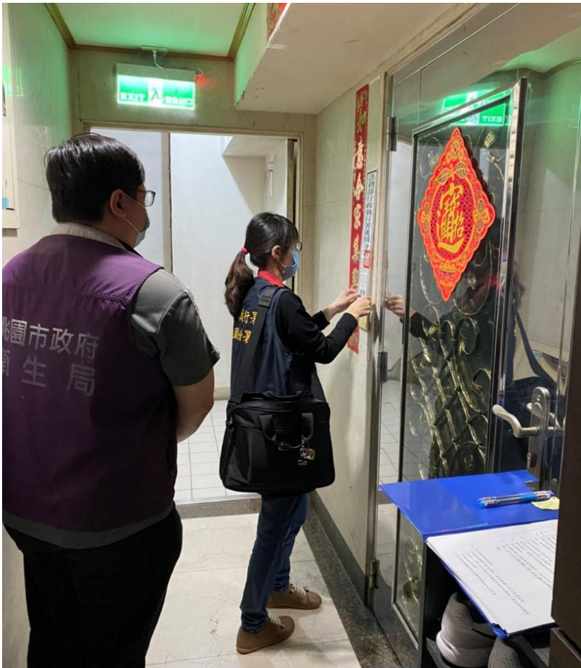
(上圖：桃園分署強力執行欠繳違反居家檢疫罰鍰義務人不動產畫面)