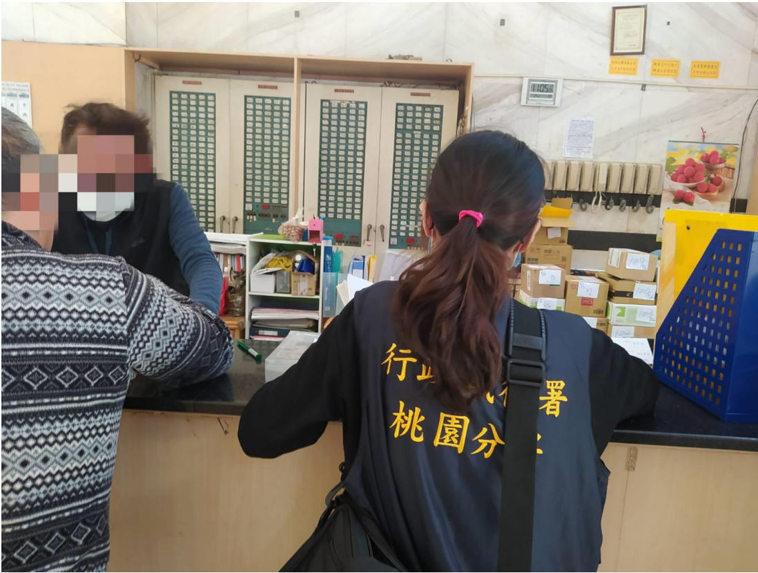
(上圖：桃園分署現場訪查欠繳違反居家檢疫罰鍰義務人畫面)