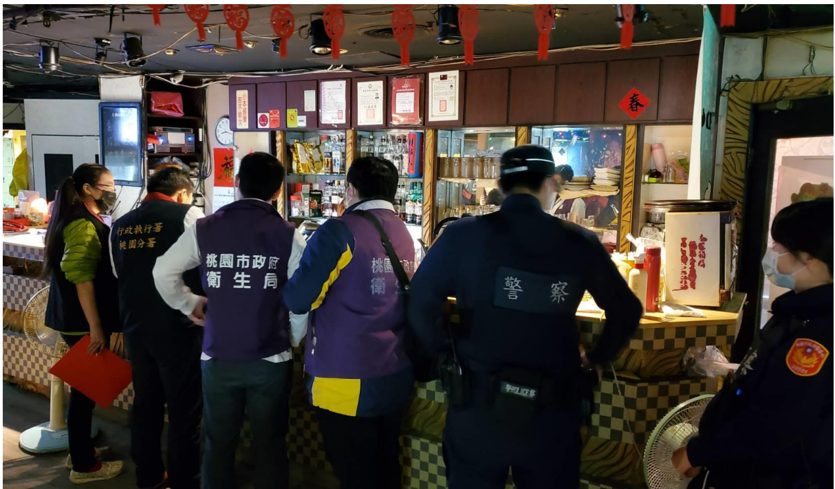
(上圖：桃園分署至欠繳違反防疫規定罰鍰營業人登記營業地址現場執行畫面)