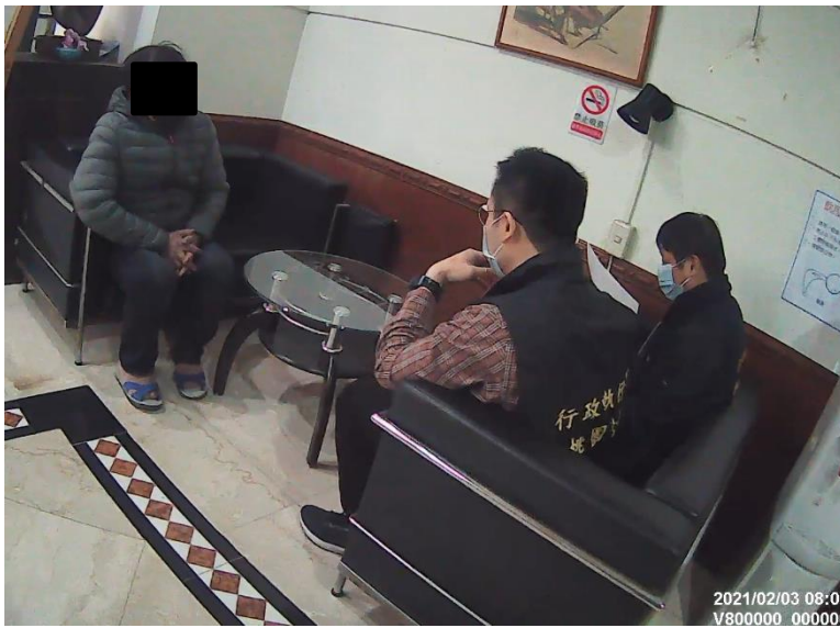
▲到達嘉○公司溫姓負責人住家外