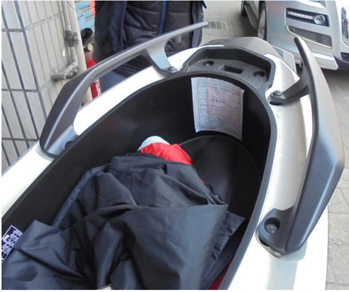
▲查封潘姓義務人的機車