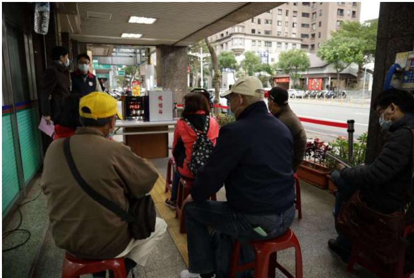
(圖：1樓騎樓不動產拍賣現場)