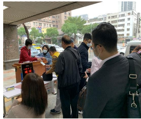
▲參與不動產投標民眾絡繹不絕(1) ▲參與不動產投標民眾絡繹不絕(2)