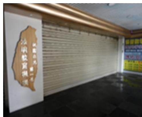
▲富國天廈社區 2 樓補習班以 4,792 萬 1,000 元拍定