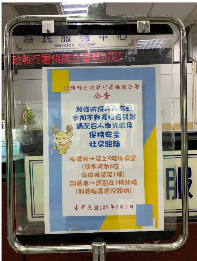
▲提醒民眾防疫措施公告