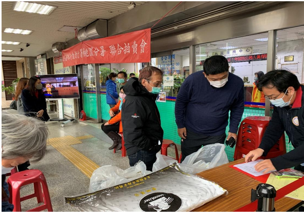
▲1樓騎樓開放空間進行動產變賣及同步直播拍賣投、開標實況