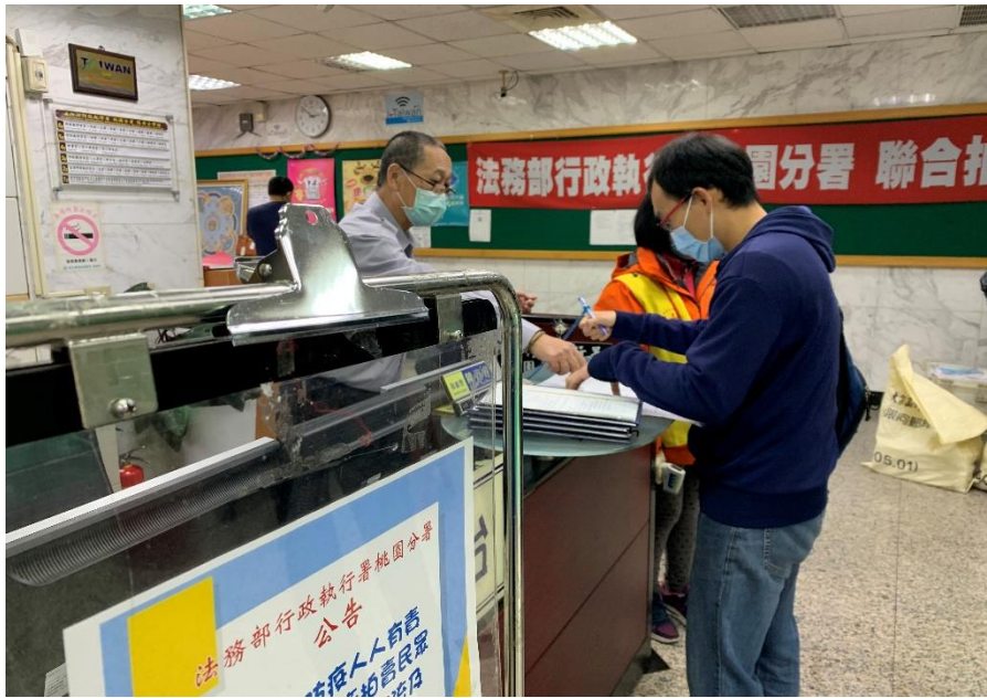
▲引導民眾填寫健康聲明書