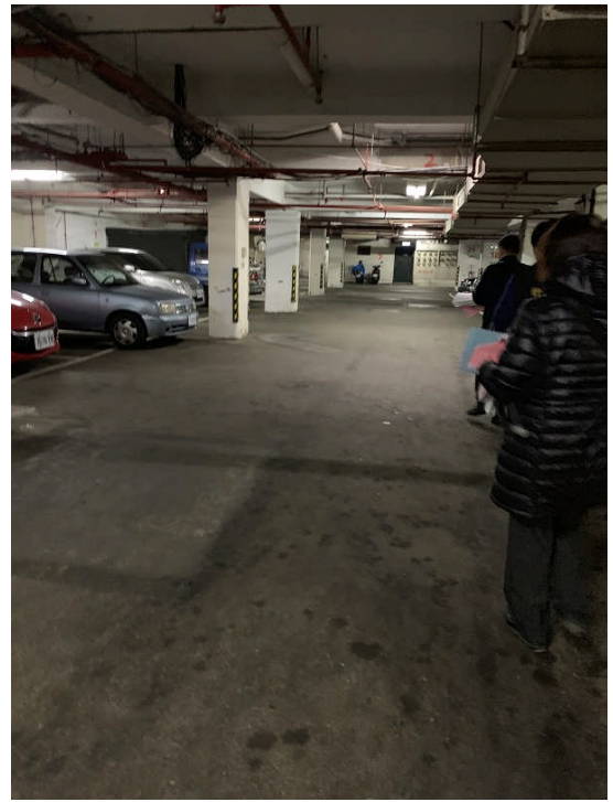
(圖：楊梅區裕城南路365號社區地下平面停車位)