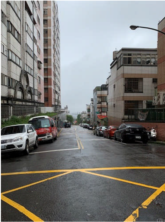
(圖：楊梅區裕城南路365號所在社區)