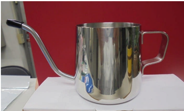
(圖：精美專業咖啡壺)