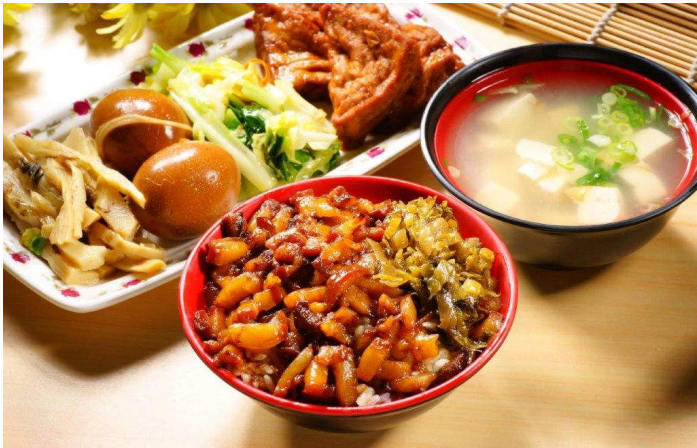
(下圖：知名豬腳連鎖業者推出多種年節商品)