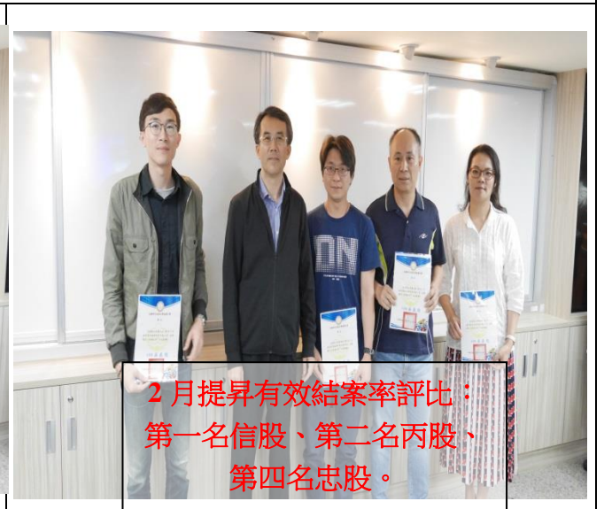
2 月提昇有效結案率評比： 第一名信股、第二名丙股、 第四名忠股。