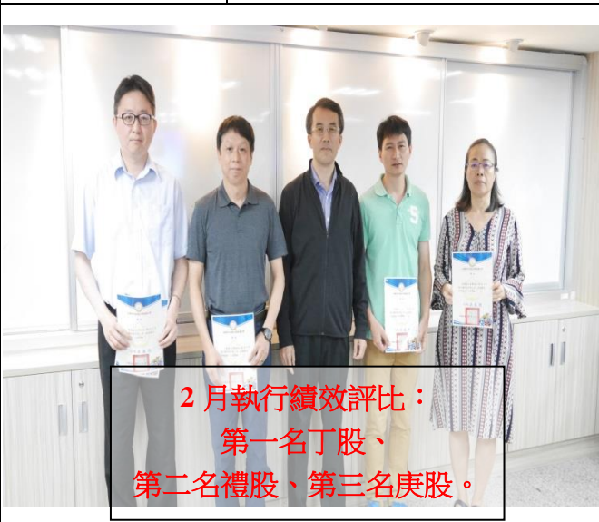
2 月執行績效評比： 第一名丁股、 第二名禮股、第三名庚股。

108.04.25 (星期四) 由分署長吳義聰主持召開本年度第三次分署會議，會議前頒發 2、3 月執行評比及酒毒駕專案執行評比之獎項。