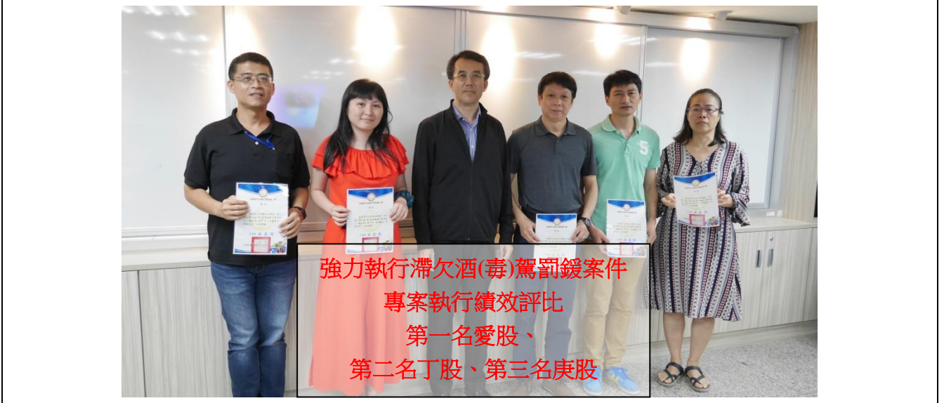
強力執行滯欠酒(毒)駕罰鍰案件 專案執行績效評比 第一名愛股、 第二名丁股、第三名庚股