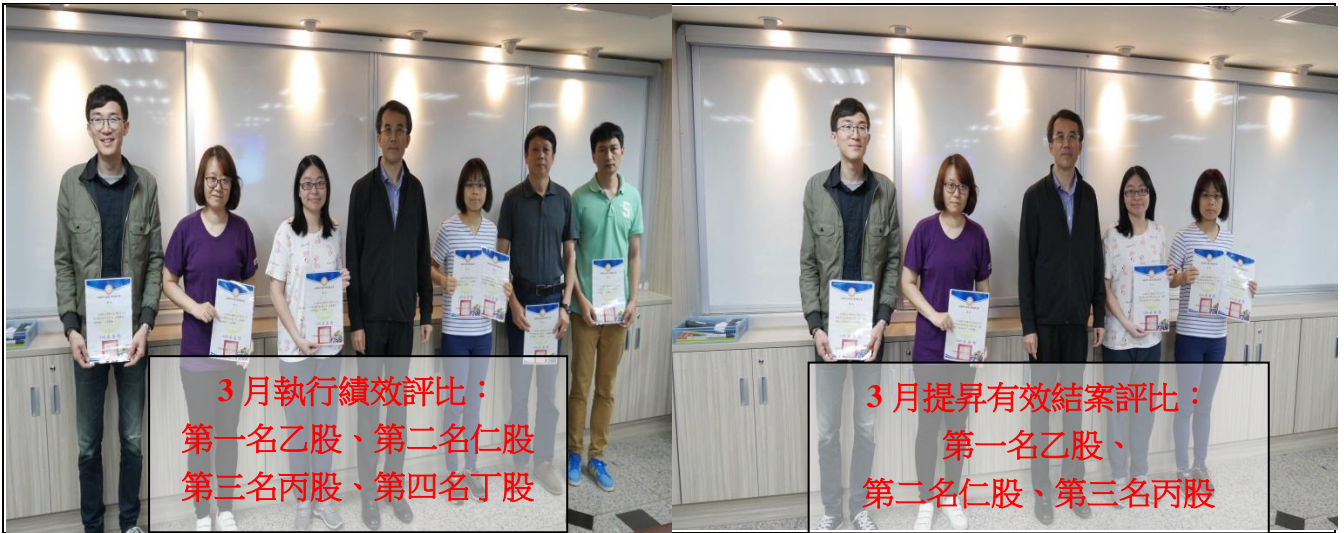
3月執行績效評比： 第一名乙股、第二名仁股 第三名丙股、第四名丁股